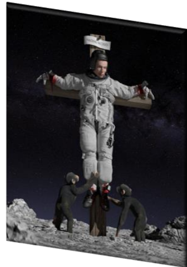
Beeple, The Passion of the Elon