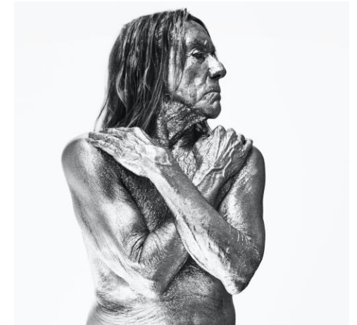
Iggy Pop – Agosto 2022