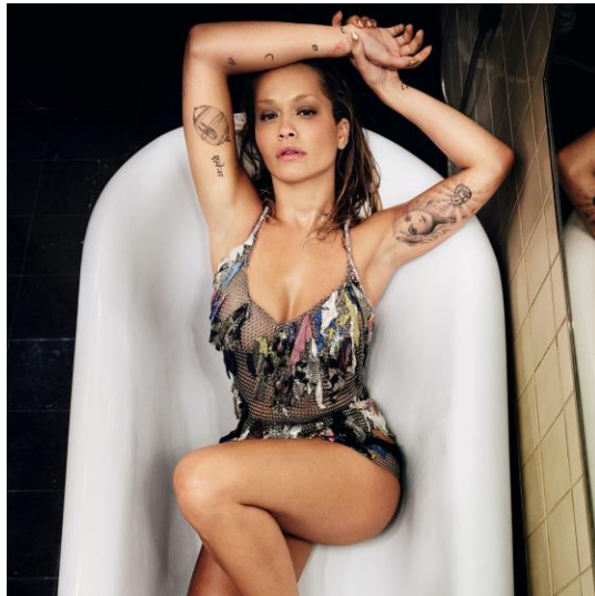
Rita Ora – Novembre 2022