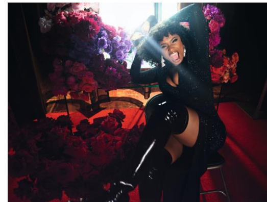
Jennifer Hudson – Luglio 2022