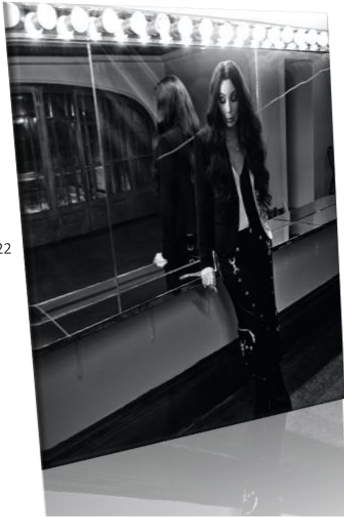
Cher – Maggio 2022

Il set del Calendario ha consentito ai musicisti di rivivere tanti momenti peculiari della vita delle loro tournée : la tensione prima dell' esibizione , gli interminabili spostamenti da una città all'altra, le pause tra le prove e i concerti , la solitudine dei momenti vissuti in una stanza di albergo. Lo stesso Adams , racconta : " Noi musicisti non vediamo mai veramente la facciata dell'edificio, ma sempre soltanto il retro : vediamo l'ingresso degli artisti , vediamo l'area del backstage , vediamo il seminterrato... si passa dall'ingresso degli artisti alla portiera della macchina a quella dell'hotel a quella del treno e poi del bus . Un sacco di porte, dunque, ma sempre di viaggio si tratta... "