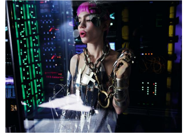
Grimes – Settembre 2022